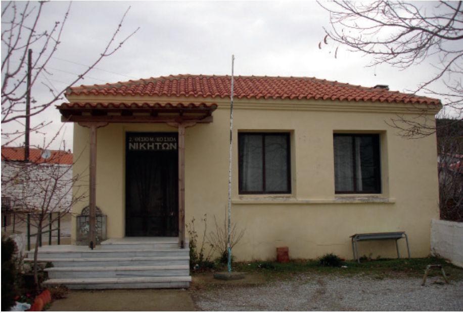
Kapanan Nikite- Üçgaziler Azınlık İlkokulu

Bu içler acısı duruma bir de 2017-2018 eğitim yılı için, azınlık okullarının askıya alınması, birleştirilmesi ve değer indirgemeleri durumları eklenmektedir.