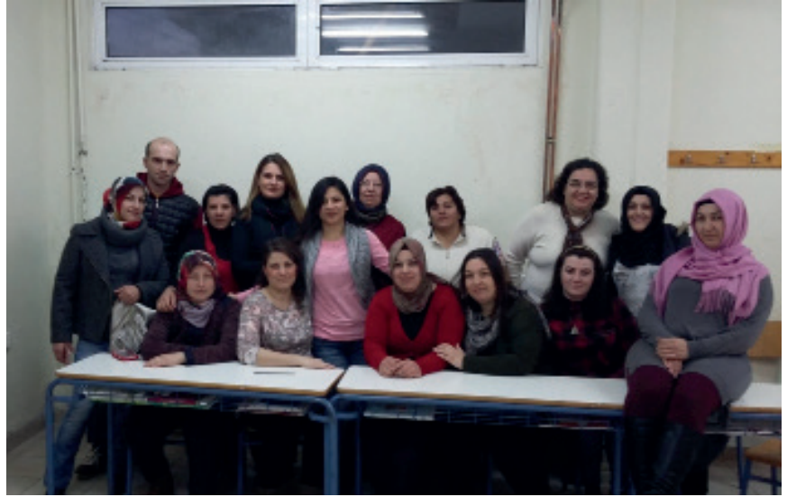
Sapas - Şapçı 2. Fırsat Okulu öğrencileri.

Yukarıda belirtilen hususlardan dolayı, telafi edilmesi zor olan çok sayıda ders saati kaybolmuştur. Bu sebep üzerine, Milli Eğitim, Araştırma ve Din İşleri Bakanlığı, genel bir düzenleme olmasına rağmen ortaya çıkan sorunları anlamaya çalışarak, bu konuyla ilgili kişiler tarafından önerilen olası tüm çözümleri incelemektedir.