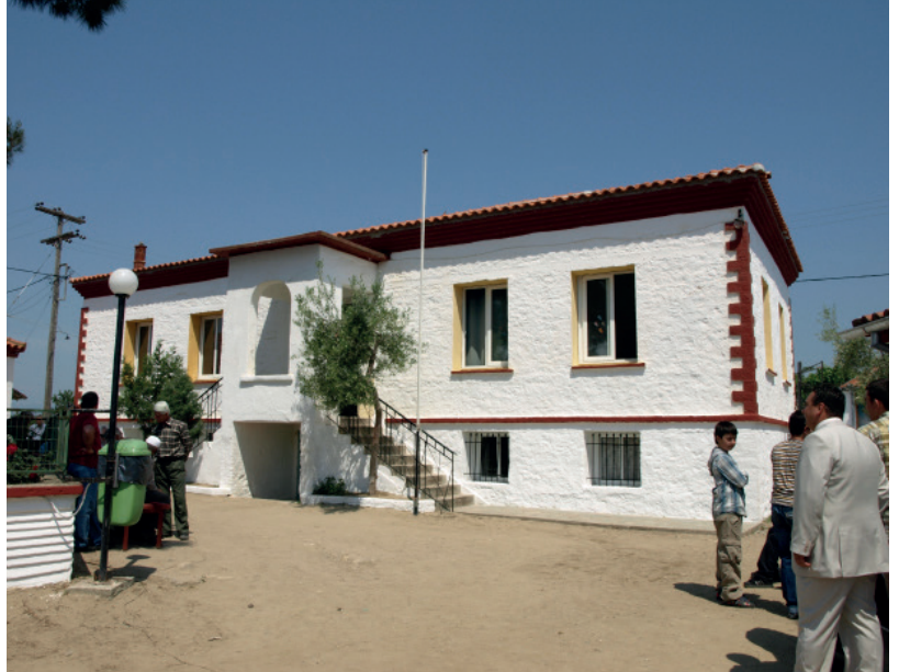
Passos - Basırlıköy Azınlık İlkokulu

(Resmi Gazete 160/A/11-08-1997), her öğretmen için öngörülen zorunlu ders saatleri üzerinden