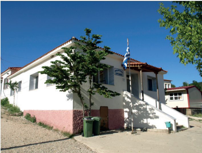
Organi - Hemetli Azınlık İlkokulu

2016 sayılı genelgesinden kaynaklanan sorunla ilgili olarak size ilişikte, Rodop ili Ortaöğretim