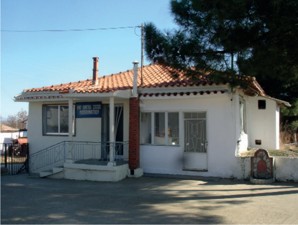
Geçtiğimiz yıllarda kapanan Mavromati- Karagözlü Azınlık İlkokulu