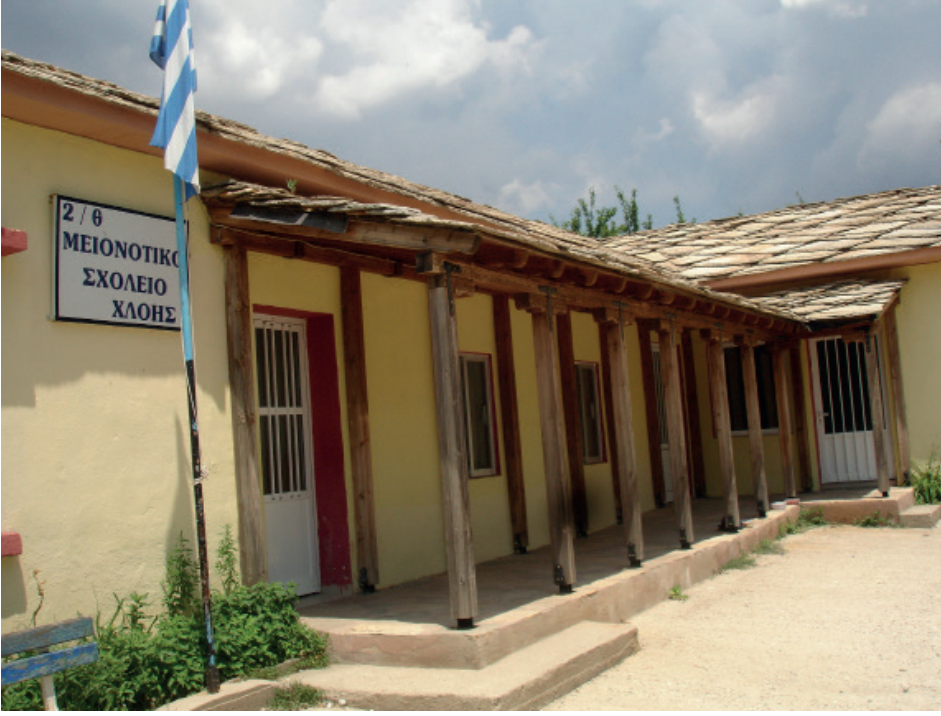
Hloi- Hebilköy Azınlık İlkokulu

baştaki talimatla ilgili ve azınlık programı okul danışmanlarının okul camiasındaki bu tedirginliği belirten evrakından sonra, yanlış anlamalara yada yanlış yorumlamalara sebebiyet vermek için, hem açıklamalı bir Basın Açıklaması hem de yeni ve açık bir talimat yayınlanmıştır.