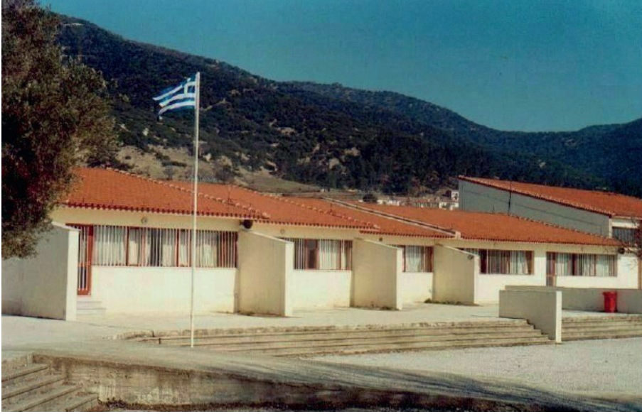
İasmos- Yassıköy Ortaokulu

yayınlanmasından sonra, bir tehlikeyle karşı karşıya kalabilir, yani Rodop iline bağlı Şapçı-Kuşanlı ve Yassıköy Genel Liseleri’nden öğrenciler Gümülcine’ye gelmek zorunda kalacaklardır, sınıfları kapatıldığı takdirde, hatta Gümülcine Meslek Lisesi EPAL öğrencileri bile