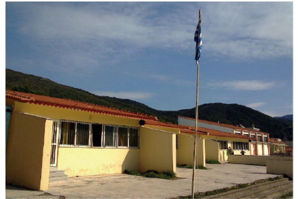
Yassıköy - İasmos Ortaokulu

A) Bölge nüfusunun genel olarak bilinen özel niteliklerinden dolayı (Rodop ili, daha özel ola-