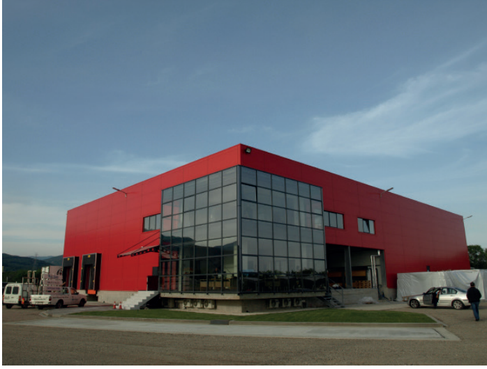
IKE Kiraz İşleme Tesisi

gibi dezavantajlı bölgelerdeki girişimlere çalışma destek primi ödenebileceği” ve ayrıca, “Kitle İletişim Araçları’na (MME) da destek yardımı verilme-